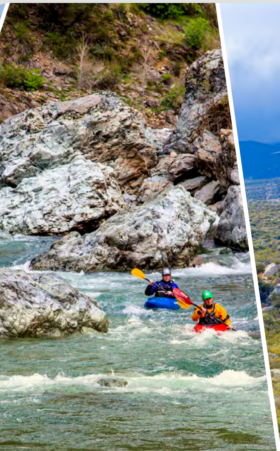
Unidad Point Arena-Stornetta, oficina regional de Ukiah