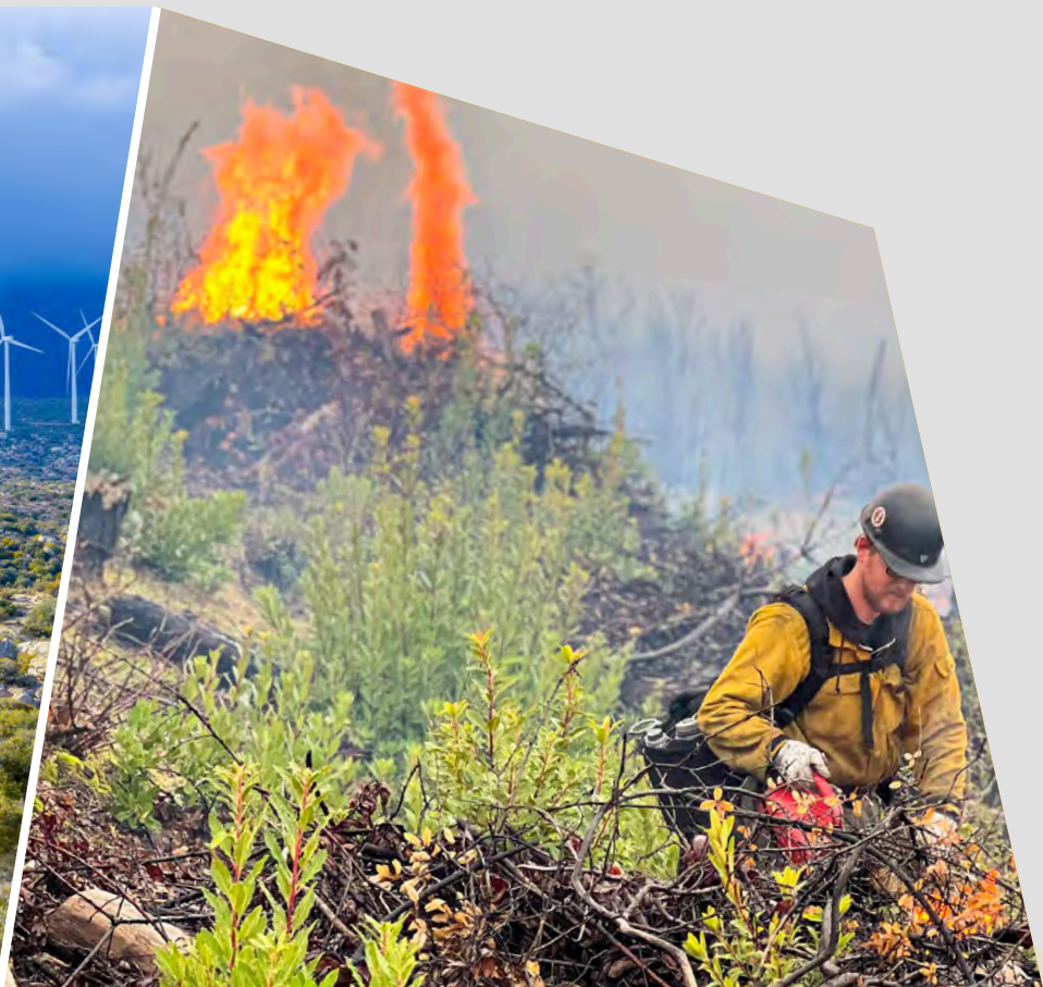
Área Recreativa de Swasey, oficina regional de Redding