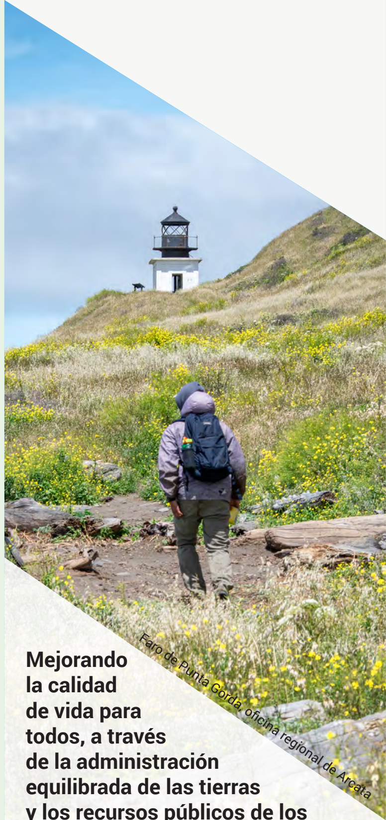
Faro de Punta Gorda, oficina regional de Arcata

$8 millones invertidos en restauración, a través de la ley bipartidista de infraestructura