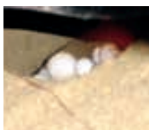
Nido de tinglar