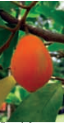
Fruta de Goetzea elegans