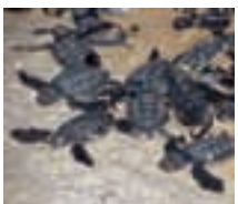
Tortuga Marina, Peje blanco