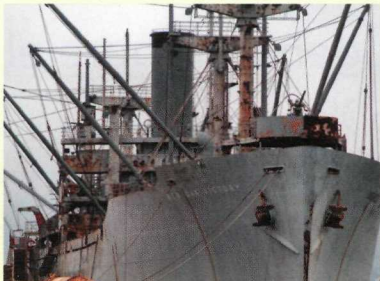
Red Oak Victory, construido en Richmond, California el 1944.

a los aliados también. Ciencia e industria al frente interno llevaron a una gran cantidad de avances tecnológicos que nos parecen corrientes a nosotros hoy, incluyendo poder atómico, propulsión a chorro, computadoras, y antibióticos.