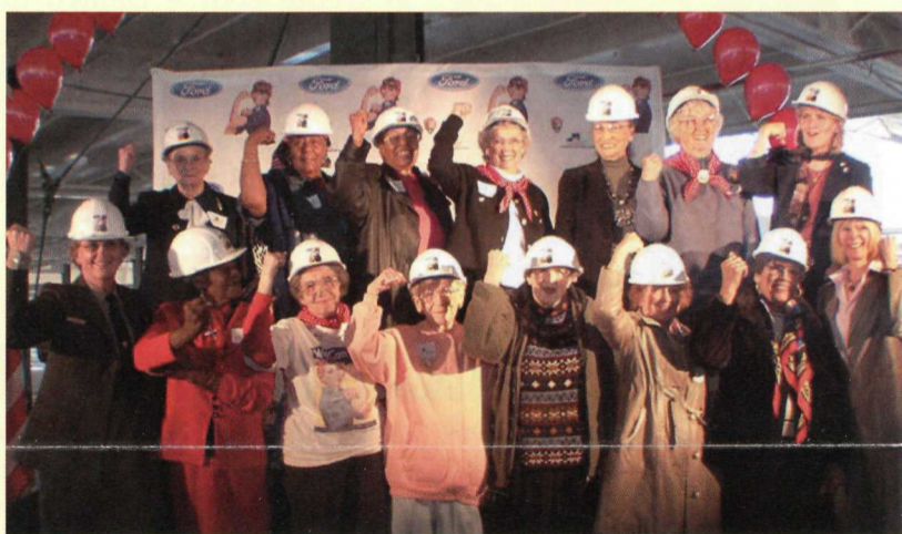
Al superior: Soldadores en su trabajo. (circa 1944) Al inferior: A reunión de "Rosies". (2003)