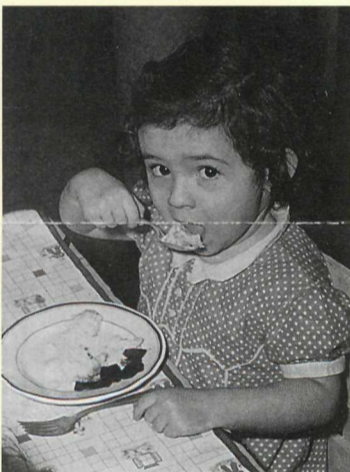
Cuidado para los niños de trabajadores ayudo a hacer cuidado de niños una institución nacional.

Impactos culturales y sociales, amplios y duraderos del frente interno de la Guerra Mundial II continúan hasta hoy día. Migración masiva de trabajadores transformaron a América de una nación rural a una urbana en muy corto tiempo formando en gran parte los patrones demográficos de la nación han existido desde la guerra. Los problemas y la promesa de América fueron expuestos mientras se tomaban pasos hacia la gran lucha por la integración racial y el tratamiento justo de minorías y mujeres en la fuerza laboral. Cuidado de niños y cuidado médico prepagado, casi inexistentes antes de la Guerra Mundial II, son instituciones de la vida americana hoy día.