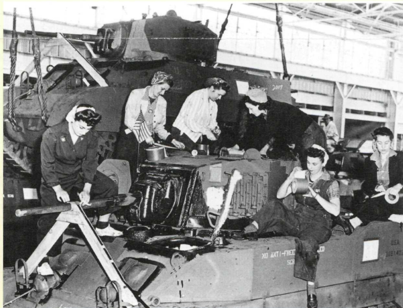
“Rosies” preparando un tanque para envío.