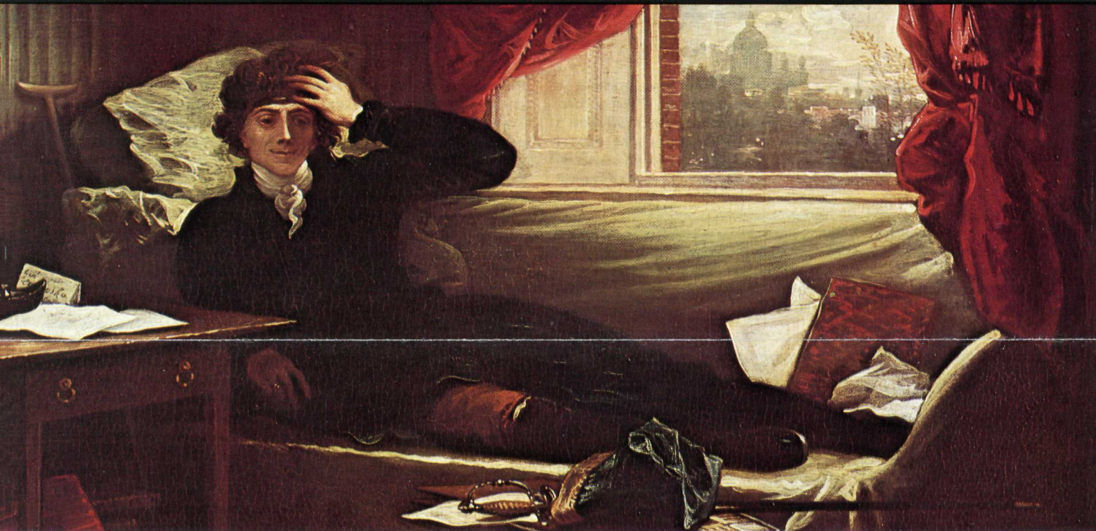
Thaddeus Kosciuszko by Benjamin West, 1797—courtesy of the Allen Memorial Art Museum.

U.S. Department of the Interior National Park Service