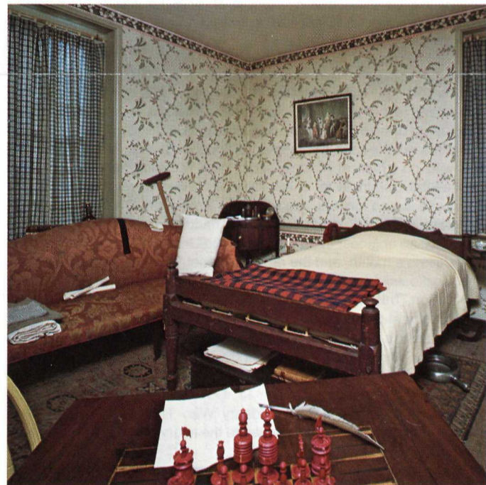
Pokój Tadeusza Kościuszki

Chociaż Kościuszko nie miał już w swoim własnym życiu zobaczyć Ojczyzny wolnej od obcej interwencji, do końca swoich dni poświęcał wszystkie siły pracując na rzecz wolności Polski. Kościuszko zmarł 15-ego października 1817-ego roku, w Solurze, w Szwajcarii.