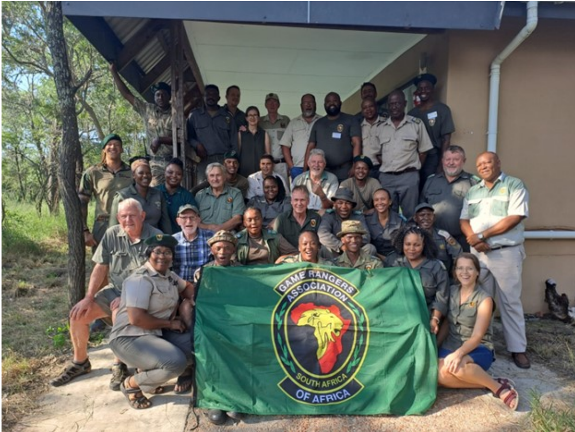
Crédito de la foto: Ashwell Glasson - Game Ranger Association of Africa - General Annual Meeting

Game Rangers Association of Africa (Asociación de Guardaparques de África - GRAA) sabe que para que las y los guardaparques africanos trabajen de forma óptima en el campo, necesitan una formación adecuada. Las y los guardaparques necesitan una amplia gama de habilidades, que deben mantenerse y desarrollarse. A través de nuestro Fondo de Capacitación de Becas, brindamos capacitación basada en evaluaciones de necesidades. En marzo, la GRAA pudo capacitar a 16 guardaparques miembro de toda Sudáfrica y Zambia en el curso de Desarrollo de Liderazgo Braveheart, presentado en el Southern African Wildlife College en Sudáfrica. GRAA identificó a Braveheart como un curso esencial para desarrollar y mejorar las habilidades de los líderes de guardaparques. El propósito de este curso es que estas personas obtengan información sobre el papel del liderazgo en la conservación y les proporcione las habilidades, el conocimiento y la actitud necesarios para agregar valor a su trabajo específico. El curso se enfoca en: