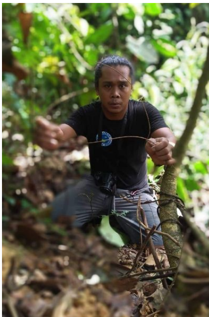
Imagen: Miembro del equipo del Sumatran Ranger Project quitando trampas en el ecosistema de Leuser, Sumatra, Indonesia.

La Fundación Delgada Línea Verde (TGLF por sus siglas en inglés) está trabajando arduamente para recaudar fondos durante los próximos 12 meses, para apoyar a más guardaparques del mundo. Nuestros socios de proyectos actuales ejemplifican las diversas necesidades de los equipos de guardaparques.