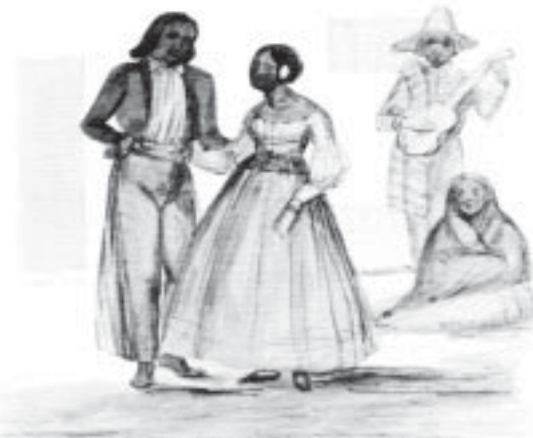
El dibujo de un fandango por James W. Abert, 1846.

Bent's Old Fort National Historic Site está situado 8 millas de La Junta en la Carretera Colorado 194, está operado por el National Park Service. El sitio está abierto todos los días del año excepto el primero de enero, el Día de Dar Gracias, y el 25 de diciembre. Las visitas a la fortaleza con guía se ofrecen diariamente. Las visitas sin guía y una película de orientación están disponibles durante las horas abiertas. Para más información sobre el horario de visitas y las entradas, llame (719-383-5010) o visite el sitio web www.nps.gov/beol .