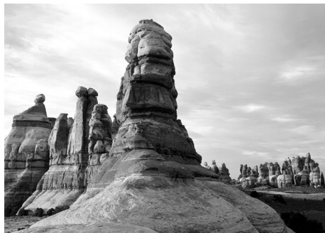
Chesler Park, The Needles

I nomi contrastanti del The Needles riflettono la diversità di questa terra: Devils Kitchen, Angel Arch, Elephant Hill e Paul Bunyans Potty. Le cuspidi rocciose scultoree, gli archi, i canyon, le fosse tettoniche e le grotte vi sorprenderanno. The Needles, pinnacoli rocciosi a strisce rosse e bianche, sono dominanti. I movimenti della terra hanno spaccato la roccia; l'acqua e il congelamento e lo scongelamento l'hanno erosa nel terreno sconnesso di oggi.