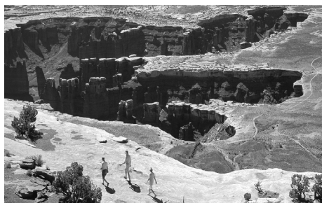
Grand View Point, Island in the Sky

Dall'US 191 prendete l'UT 313 verso sud dell'Island in the Sky. Una strada asfaltata continua attraverso la mesa. Servizi: centro visitatori, strade per veicoli a quattro ruote motrici, sentieri autoguidati e primitivi, aree per campeggio attrezzate, aree per campeggio primitive (è necessario un permesso), aree per picnic, punti di veduta, mostre lungo la strada, racconti e programmi delle guide (periodicamente) e tour commerciali dei paesi vicini. L'acqua è disponibile da marzo a ottobre presso il Centro Visitatori dell'Island in the Sky; è addebitato un costo per l'ingresso e per il campeggio. Aperto tutto l'anno.