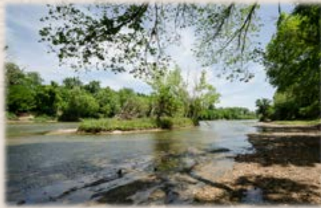
Colorado River Río Colorado

Vast open skies. Swollen streams and great rivers. Lush rolling hills and deep forests. Dark swamps and hot deserts. This varied and expansive landscape was home to American Indians for hundreds of years. The land offered no apparent riches, but Spain was intent on protecting its territory from France. Spaniards claimed this land and named it Tejas for the Caddo word meaning friend. Missionaries and soldiers traveled time-worn routes, built missions and presidios (military posts), and opened a camino real (royal road), a vital artery across the heart of the land. El Camino Real de los Tejas brought change—exploration, trade, migration, settlement, war, independence, and statehood. It fostered cultural interactions and created a distinctive mosaic of language and lifeways.