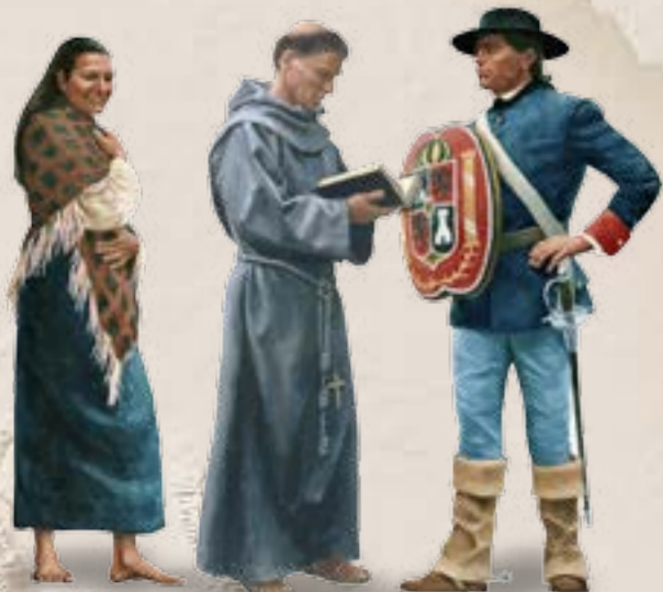
Coahuiltecan Indian Indígena coahuilteca Franciscan Missionary Misionario franciscano Spanish Soldier Soldado español NPS / ILLUSTRATIONS BY GIL COHEN