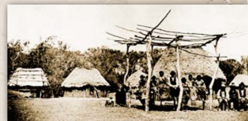
Caddo village, ca. 1870