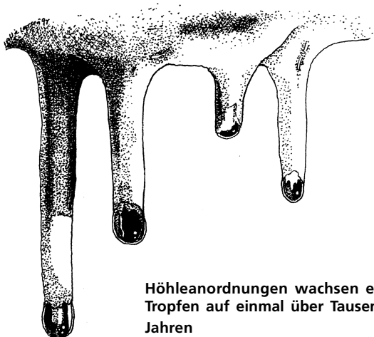
Höhleanordnungen wachsen einen Tropfen auf einmal über Tausenden Jahren

Tropfenden Wasser kommt noch zum den Höhlen Zimmern. Jedes Tropf trägt ein bißchen gelöste Kalk. Wann die Lösung ausgesetzt zu der Luft der offenen Kammer war, die Kohlendioxid entgeht von der Lösung. Daß erlaubt Kalzit und andere Mineralen zu abgelagern auf die Wänden, Decke und den Boden. Diese Ablagerungen erzeugte die schönen und mysteriösen Kalzitschmuck die wachsen noch Heute. Lehman Höhle ist verschmückt mit fantastischen exemplare von Stalaktiten, Stalagmiten, Säulen, Vorhänge, Wandsinter, Helaktiten, und Seltene Schild Formationen.