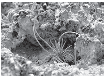
Encroûtement du sol cryptobiotique