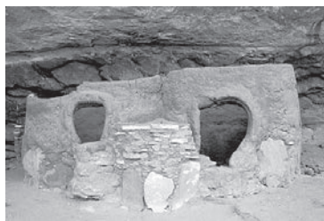
Horsecollar Ruin emprunte son nom à la forme des deux portes vers les greniers.