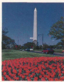
Das Washington Monument Dieses Denkmal in Form eines riesigen Obelisken liegt an der Constitution Avenue und der 15. Strasse, NW. Im Jahre 1833 wurde eine Gesellschaft gegründet, deren Ziel es sein sollte, "ein würdiges Nationaldenkmal für Washington zu schaffen". Fünfzehn Jahre später wurde der Grundstein gelegt. Nach vielen Schwierigkeiten und Verzögerungen wurde das Denkmal 1888 der Öffentlichkeit zugänglich

schiedenen Bewohnern gesammelt worden. Es ist dienstags bis samstags von 10 bis 12 Uhr morgens geöffnet. Vom Memorial Day (dem 30. Mai) bis Labor Day (dem ersten Montag im September) werden Eintrittskarten verlangt. Bei offiziellen Anlässen ist es geschlossen. Körperbehinderte können den nördlichen Eingang an der Pennsylvania Avenue benutzen. Tel. 755-7798