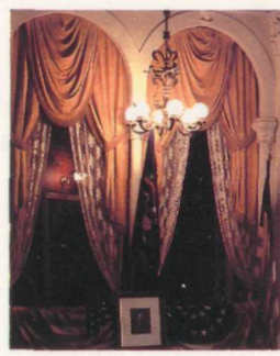
Ford's Theater (Das Ford-Theater) ist ein Abraham Lincoln gewidmetes Museum im Haus Nr. 511 der 10. Strasse, NW, und das Sterbehaus Lincolns (House Where Lincoln Died) ist direkt gegenüber, Nr. 516 der 10. Strasse, NW. Das restaurierte Ford-Theater, der Tatort der Ermordung Präsident Abraham Lincolns am 14. April 1865, ist ein bedeutendes Denkmal für den Präsidenten der Bürgerkriegszeit. Hier finden

gemacht. Die Besucher fahren im Aufzug 150 m hoch. Öffnungszeiten täglich von 9 - 17 Uhr, im Frühling und Sommer von 8 Uhr morgens bis Mitternacht. Vom Parkplatz und der 15. Strasse führen Platte über einen kleinen Hang zum Eingang. Tel. 426-6841.