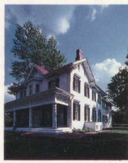
Das Frederick-Douglass-Haus befindet sich an der 14. und "W" Strasse, SW. Frederick Douglass wurde als Sklave geboren und wurde nach dem Bürgerkrieg ein bedeutender Schriftsteller, Redner und Vorkämpfer der Bürgerrechtsbewegung. Von 1877 bis zu seinem Lebensende im Jahr 1895 lebte er hier im "Cedar Hill" (Zedernhügel). Die Originalausstattung des Hauses stammt aus Douglass' späteren Jahren, als er diplomatischer Vertreter der USA in Haiti war. Geöffnet von 9 bis 17 Uhr im Sommer und von 9 bis 16 Uhr im Winter. Das Besucherzentrum bietet Ausstellungen und einen Film. Vom Washington Memorial können Sie von Juni bis Anfang September zweimal täglich per "Tourmobile" zum Frederick-Douglass-Haus fahren. Das "Tourmobile" fährt auch am Mary-McLeod-Bethune-Memorial in Lincoln Park vorbei. Tel. 426-5960.

das ganze Jahr über Theateraufführungen statt. Die Spielzeiten sind aus der Tagespresse zu erfahren. Karten werden an der Theaterkasse verkauft. Tel. 347-4833. Museum und Sterbehaus sind täglich von 9 bis 17 Uhr geöffnet. Das Theater schliesst donnerstags um 12 Uhr, und sonntags um 14 Uhr. Tel. 426-6927.