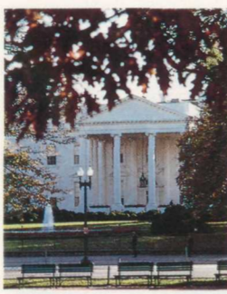
The White House (Das Weisse Haus) , 1600 Pennsylvania Avenue, NW, war die offizielle Residenz aller amerikanischen Präsidenten mit Ausnahme George Washingtons, der das Grundstück auswählte. Nachdem es 1814 von den Briten ausgebrannt worden war, wurde es wieder aufgebaut und weiss getüncht, daher der Name Weisses Haus. Die Möbel und Einrichtungsgegenstände sind im Laufe der Geschichte von seinen ver-

schiedenen Bewohnern gesammelt worden. Es ist dienstags bis samstags von 10 bis 12 Uhr morgens geöffnet. Vom Memorial Day (dem 30. Mai) bis Labor Day (dem ersten Montag im September) werden Eintrittskarten verlangt. Bei offiziellen Anlässen ist es geschlossen. Körperbehinderte können den nördlichen Eingang an der Pennsylvania Avenue benutzen. Tel. 755-7798