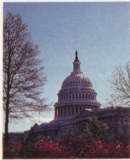
The U.S. Capitol (Das Kapitol) Capitol Hill. Die Hallen dieses herrlichen Gebäudes haben die bedeutendsten Männer der amerikanischen Geschichte gesehen. Der Bau wurde im Jahr 1793 begonnen. Am 22. November 1800 sprach Präsident John Adams vor einer Sitzung des Kongresses im Senatssaal; aber völlig fertiggestellt wurde das Gebäude erst im Jahre 1867. Öffnungszeiten täglich von 9 bis 16.30 Uhr, ausser an Neujahr, Thanksgiving (Erntedanktag am vierten Donnerstag im November) und Weihnachten. Führungen beginnen in der Rotunde alle paar Minuten von 9 bis 15.45 Uhr. Ein Eingang zu ebener Erde unter dem Säulenvorbau sowie viele Rampen und Aufzüge im Inneren erleichtern Körperbehinderten den Besuch. Auch Rollstühle stehen zum Verleih bereit. Tel. 225-6827.