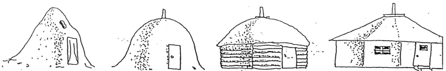
Hutte hogan conique