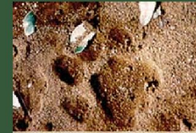
Dấu sư tử