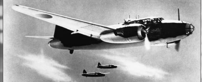
Mitsubishi G4M medium bombers, Allied codename "Betty," early 1940s. 1940年代初期の三菱G4M 1式陸上攻撃機、連合国軍暗号名「ベティ」

米軍兵士はこの貯蔵庫とアスリート飛行場の構造を修理し、後にイスレイ飛行場と呼ばれる新しいB-29爆撃機の航空基地となった。