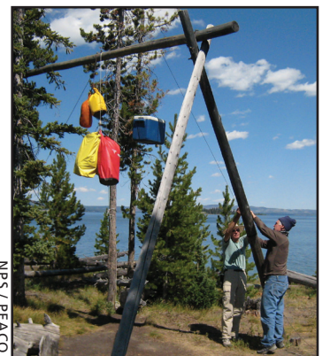
喺偏遠地方安全保存食物