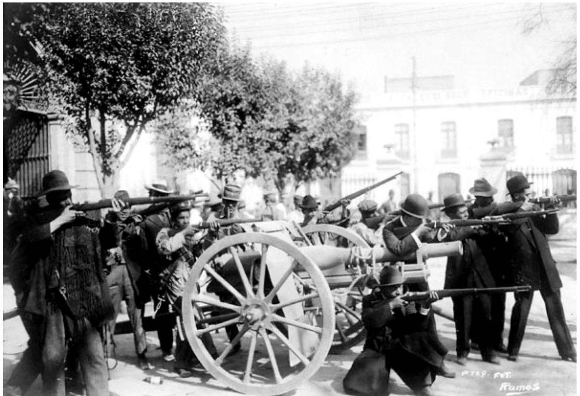
Batalla de la Revolución Mexicana

Aunque los historiadores continúan discutiendo sobre cuando la revolución mexicana terminó oficialmente, recientemente, muchos eruditos han clamado que no terminó hasta 1940. Esto es debido al hecho que a través de los años 20 y 30s había movimientos revolucionarios, elecciones injustas, y varias guerras civiles en México. Todo esto comenzó a cambiar cuando en 1934 Lázaro Cárdenas fue elegido por la gente—él no había fingido las elecciones como sus precursores. En 1940, después de seis años brillantes en oficina como presidente, Cárdenas fue votado fuera. Qué hace que Cárdenas sobresalga a sus precursores es que él dejó su puesto voluntariamente, es decir, fue elegido y fue sacado de oficina de manera democrática.