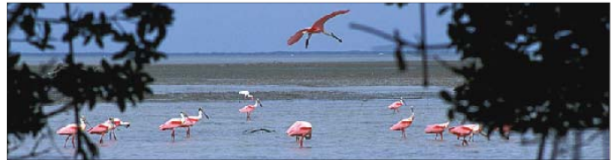
Espátulas rosadas alimentándose en Florida Bay.

Información local para los visitantes Everglades City Chamber of Commerce 239-695-3941 ó 800-914-6355 Homestead/Fla. City Chamber of Commerce 305-247-2332 Greater Miami Chamber of Commerce 305-350-7700 Key Largo Chamber of Commerce 800-822-1088 Naples Chamber of Commerce 239-262-6141 Key West Welcome Center 305-294-2587 Tropical Everglades Visitor's Association 800-388-9669