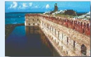
Parque Nacional Dry Tortugas

El centro está abierto de 9.00 a 16.00, de martes a sábados, y está ubicado en Truman Annex: 35 East Quay Road, Key West, FL 33040. Para obtener más información llame al 305-809-4750.