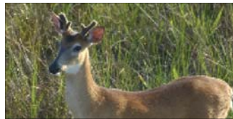
Ciervo de cola blanca