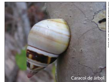
Caracol de árbol

360 Degrees of Dry Tortugas National Park. Four Chambers Studio. Recorrido interactivo. $17.95. Descubra este parque nacional único ubicado en la "puerta de entrada del golfo" utilizando su computadora.