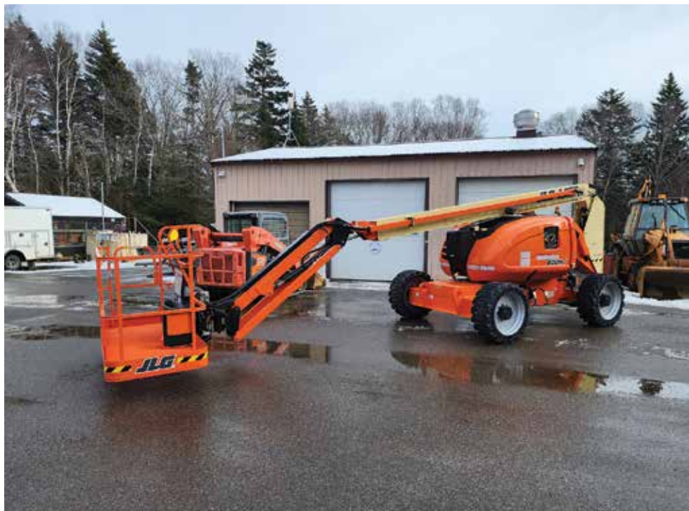
Le remplacement des équipements d'entretien essentiels se poursuit.

Le Parc continue de travailler à la réalisation d'une étude d'impact environnemental en vue de la mise en œuvre de notre sentier le plus excitant à ce jour, qui relierait Lower Duck Pond et Upper Duck Pond par une passerelle flottante traversant les marais.