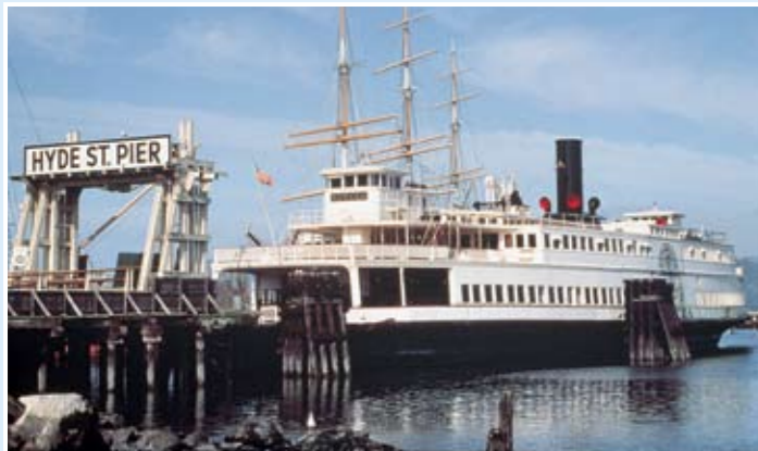
Eureka號：船側明輪渡船；299.5呎；原名Ukiah號，先於1890年在加州Tiburon建造；1922年重建，改名Eureka號。