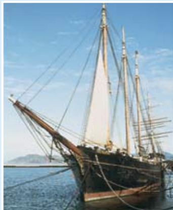
C.A. Thayer號：三桅縱帆船；156呎；於1895年在加州Fairhaven建造。