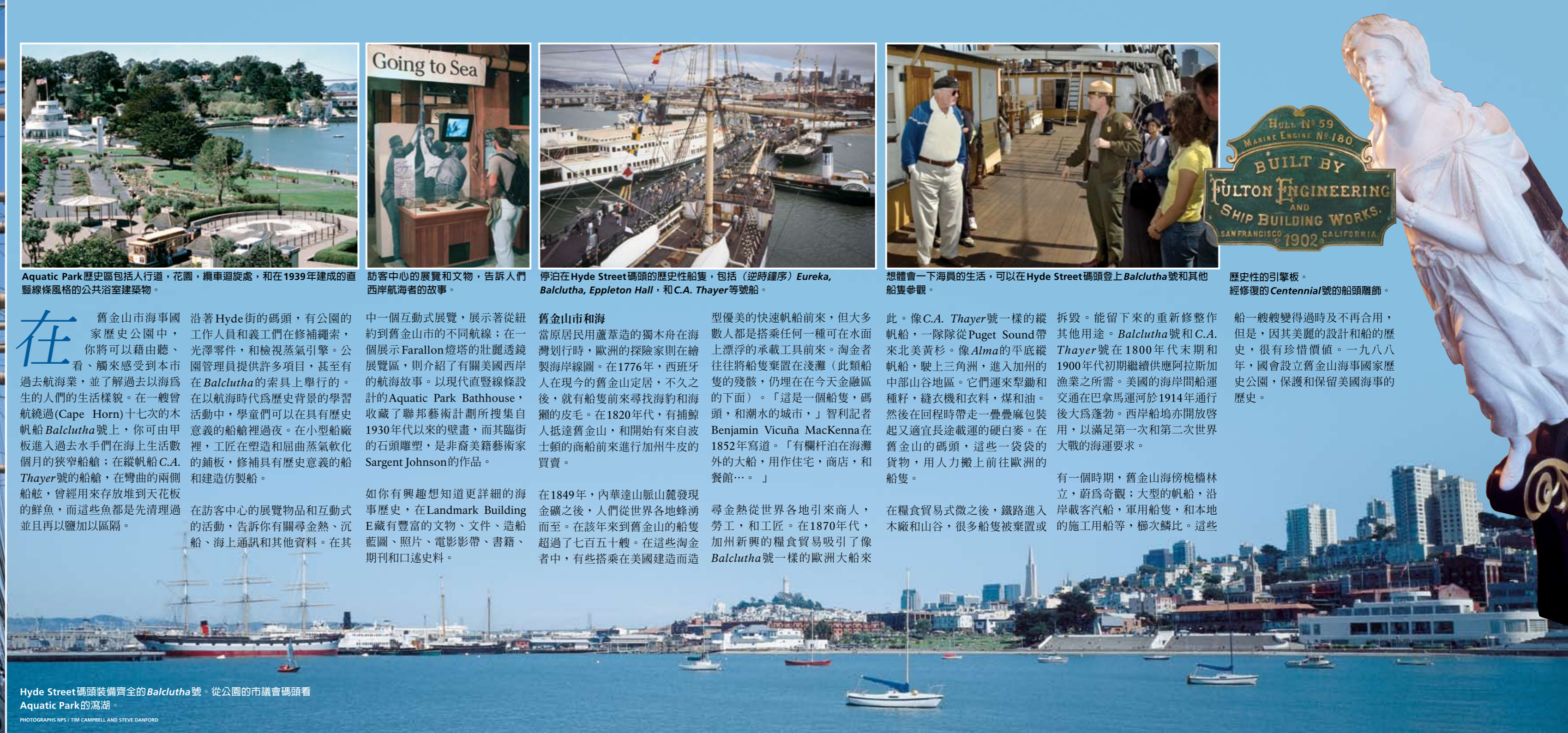
Hyde Street 碼頭裝備齊全的 Balclutha 號。從公園的市議會碼頭看 Aquatic Park 的瀉湖。

船一艘艘變得過時及不再合用，但是，因其美麗的設計和船的歷史，很有珍惜價值。一九八八年，國會設立舊金山海事國家歷史公園，保護和保留美國海事的歷史。