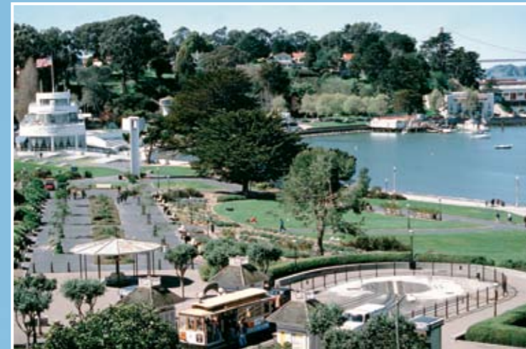
Aquatic Park 歷史區包括人行徑、花園、纜車迴旋處，和在 1939 年建成的直豎線條風格的公共浴室建築物。