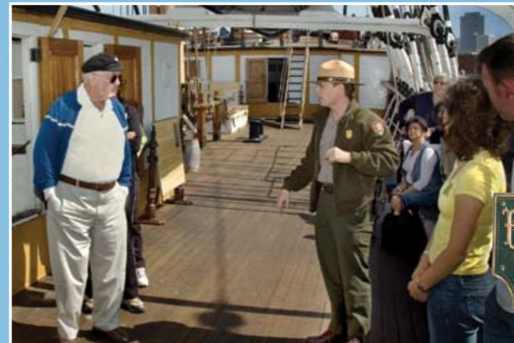
想體會一下海員的生活，可以在 Hyde Street 碼頭登上 Balclutha 號和其他船隻參觀。