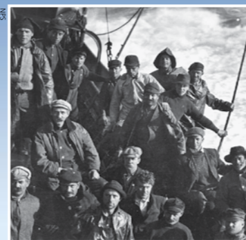
左上：三文魚漁人在Star of Alaska號上，加州，1920年代；右上：公園的研究圖書館；下：蒸氣船小冊，1880年代。