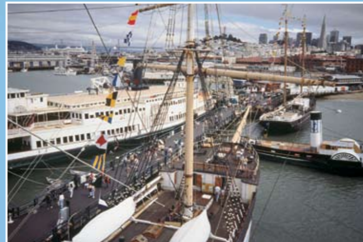
停泊在 Hyde Street 碼頭的歷史性船隻，包括（逆時鐘序）Eureka, Balclutha, Epplerton Hall, 和 C.A. Thayer 等號船。