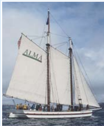
Alma號：平底縱帆船；59呎；於1891年在加州舊金山建造。

小型船隻 ：公園的船廠，亦有修理未有提及但日常作為施工或遊樂用的以下船隻：三桅小帆船，Monterey船和遊艇。船廠亦為公眾舉辦課程。