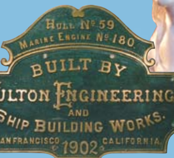
歷史性的引擎板。經修復的 Centennial 號的船頭雕飾。

在舊金山市海事國家歷史公園中，你將可以藉由聽、看、觸來感受到本市過去航海業，並了解過去以海為生的人們的生活樣貌。在一艘曾航繞過(Cape Horn)十七次的木帆船 Balclutha 號上，你可由甲板進入過去水手們在海上生活數個月的狹窄船艙；在縱帆船 C.A. Thayer 號的船艙，在彎曲的兩側船舷，曾經用來存放堆到天花板的鮮魚，而這些魚都是先清理過並且再以鹽加以區隔。