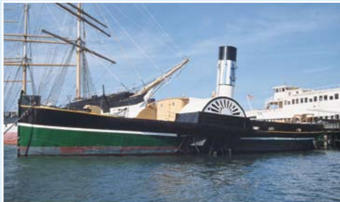
Epplerton Hall號：鋼拖船；100.5呎，於1914年在英國South Shields建造。