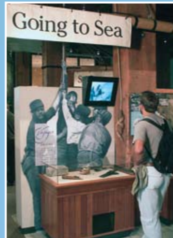
訪客中心的展覽和文物，告訴人們西岸航海者的故事。