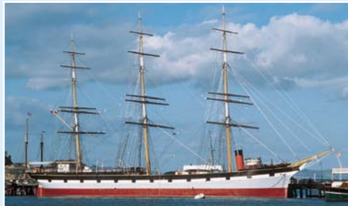
Balclutha號：橫帆船；256呎；於1886年在蘇格蘭格拉斯哥建造。