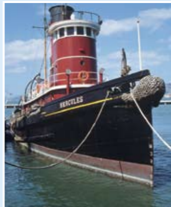
Hercules號：蒸氣推動拖船；139呎；於1907年在新澤西州Camden建造。