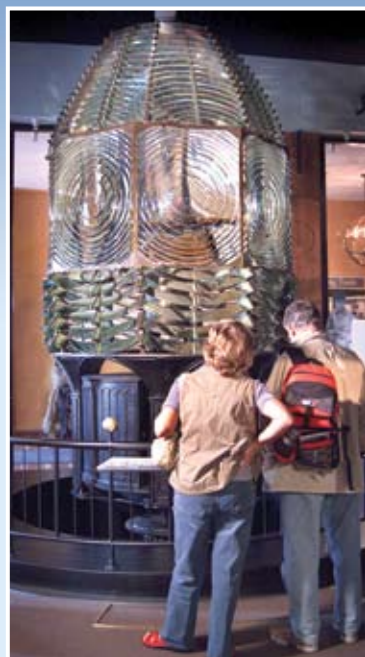
Printed Spring 2008. Printed on recycled paper. Chinese version.