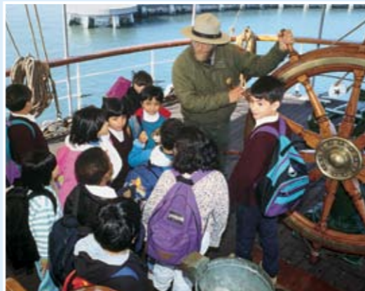
學童在Balclutha號上。公園管理員為不同年齡的訪客提供講解。