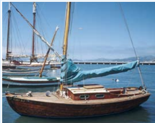
在Hyde Street碼頭東邊停泊的小船。