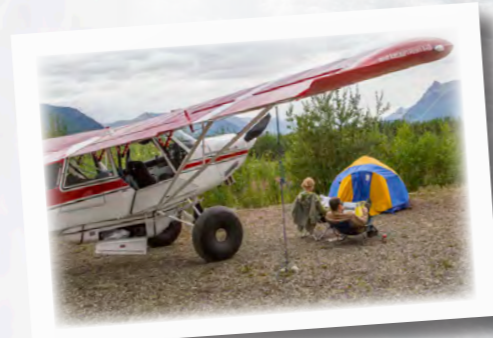
照片，从左至右： 冰山攀登者，鲁特冰川；空林停机坪露营；穿鞋鞋在鲁特冰川安全徒步旅行

库珀河从奇提纳流淌至阿拉斯加湾，靠近科尔多瓦地区，流经公园最崎岖的部分地区。海上皮划艇爱好者可以前往冰海湾和亚库塔特地区进行探索。在冬季和春季，越野滑雪板带来了另一种探索方式。露营者会喜欢这里八月和九月的凉爽天气，且蚊子较少。想要俯瞰全景，你可以乘坐或包租一架直升机。